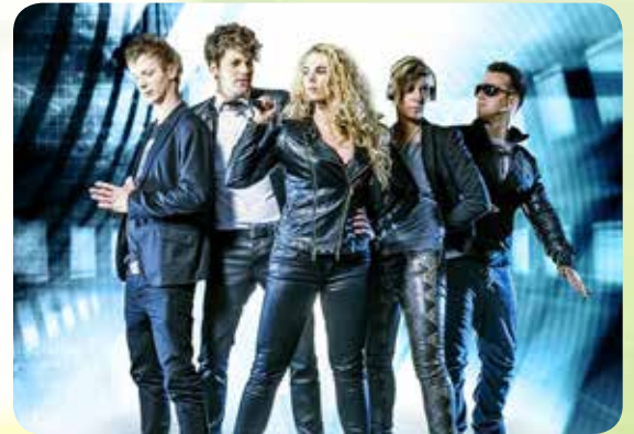
19/08 • Q5 NEW STYLE