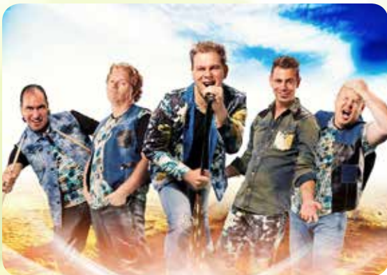
15/07 • WIR SIND SPITZE