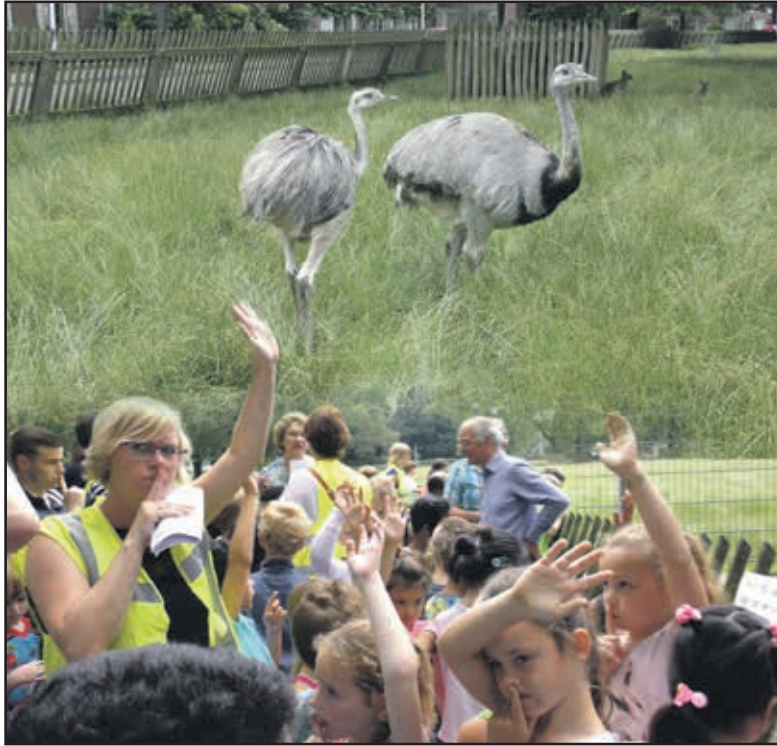
De nieuwe bewoners van het Hortensiapark werden vrijdag geïntroduceerd door kinderen van BS Goede Herder. (l) het vrouwtje 'Nandoe' met aan haar zijde het mannetje: 'Navoe'.

Helmond kent drie prachtige openbare dierenparken; de Warande, de Rippert in de wijk Rijpelberg en het Hortensiapark. In het laatstgenoemde dierenpark, werd vrijdag 24 juni het vijftigjarig bestaan gevierd.