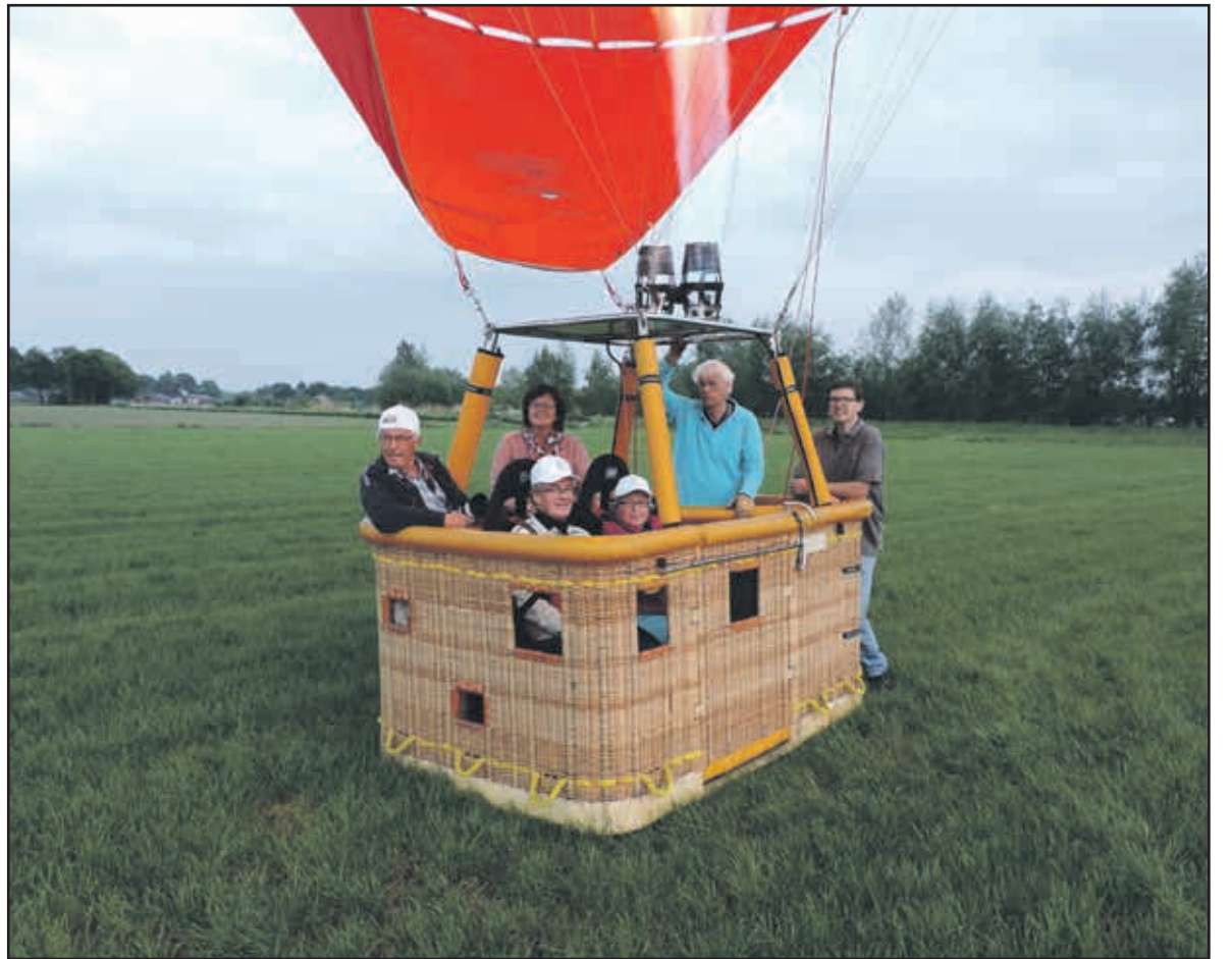
Sinds kort is het mogelijk een ballonvaart te maken met een aangepaste luchtballon van de Zonnebloem

tot de landingsplek tussen Deurne en Bakel. Door het heldere weer waren Brandevoort, Mierlo-Hout, Ganzewinkel, Suytkade en Helmond te bewonderen. Hun eigen huis maar ook huizen van bekenden waren duidelijk van boven te zien. Na ruim een uur genoten te hebben werd geland in een weiland en werd de tocht afgesloten met een champagne-doop. Met de Zonnebloem kan er meer dan je denkt. ■