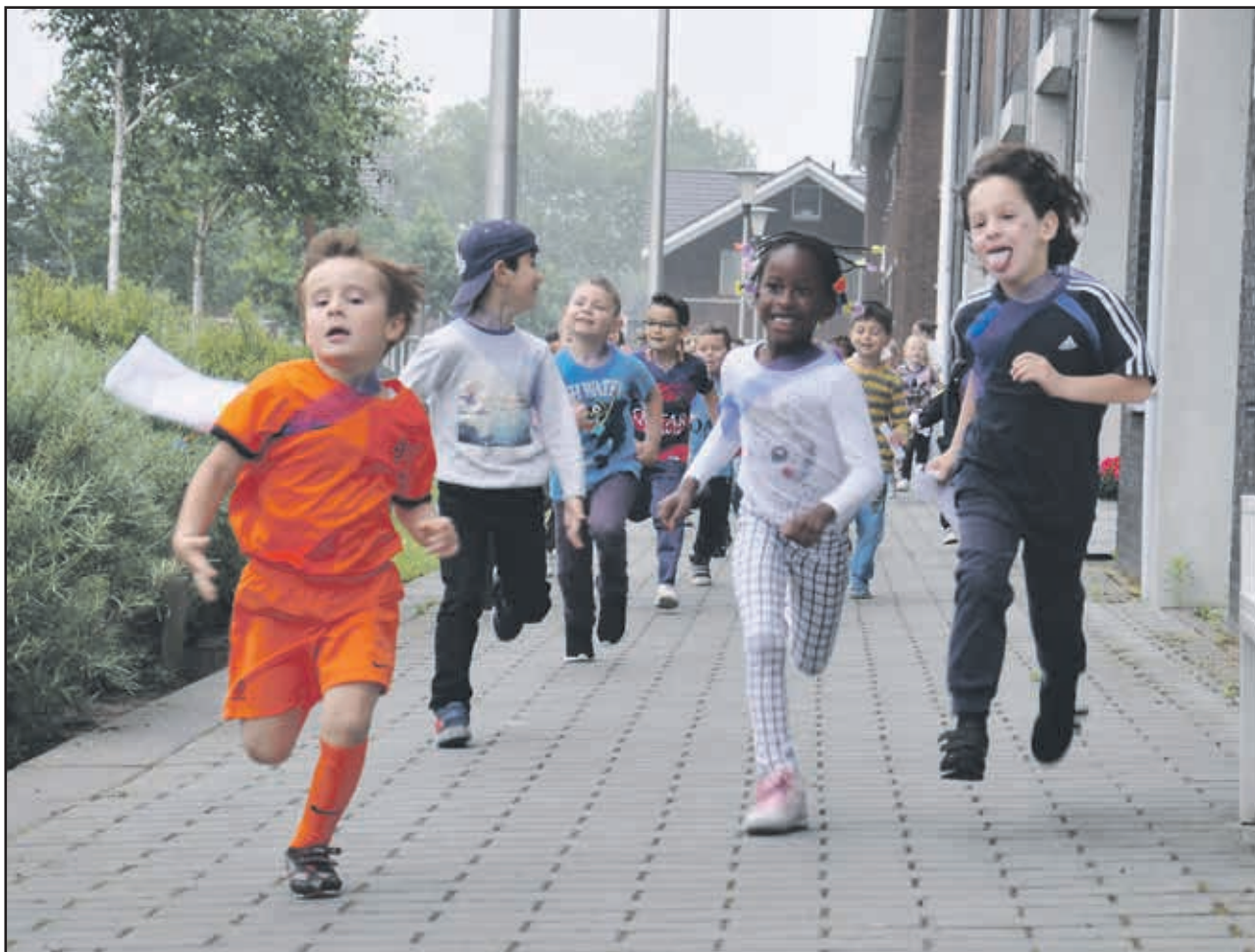
De kinderen van de Vuurvogel hebben een sponsortocht gelopen voor Warchild.