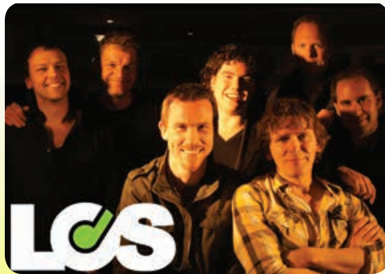
12/08 • LOS NEDERPOPCOVERS