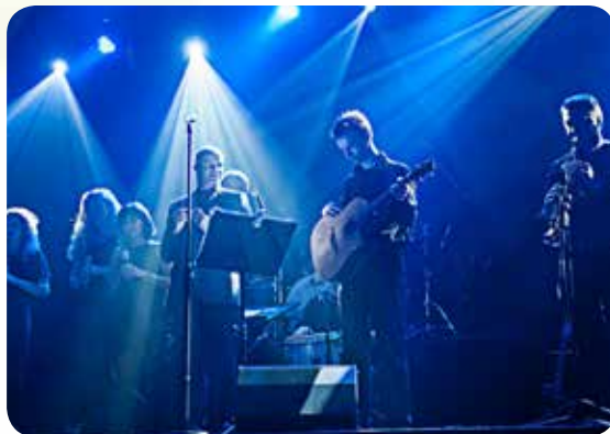
22/07 • DYNAMIC ORCHESTRA