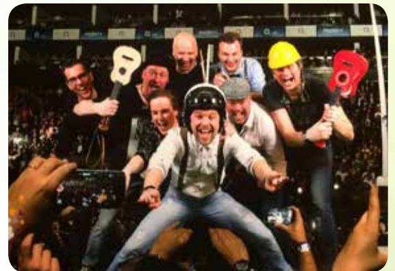
29/07 • MILLERS INC.