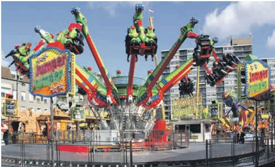
De Jumper is een van de attracties op de Helmondse zomerkermis.

De zomerkermis wordt dit jaar gehouden van 7 tot en met 13 juli. Er staan zo'n 60 attracties op en rond de Markt, het Ameideplein, de Watermolenwal, het Speelhuisplein en het Havenpark.