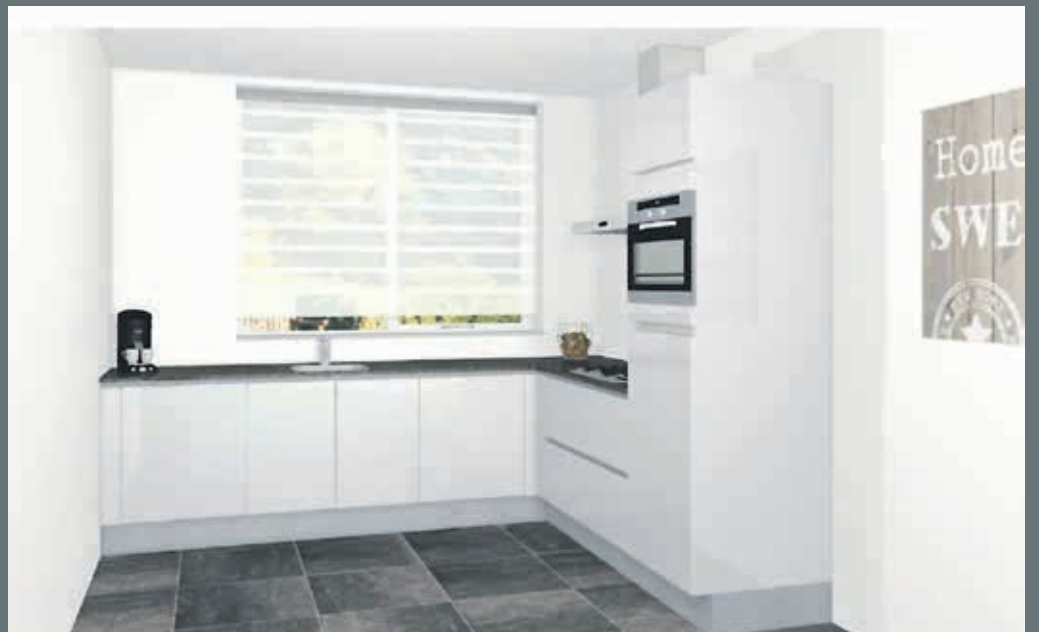
De afgebeelde keuken is een meerwerk-optie