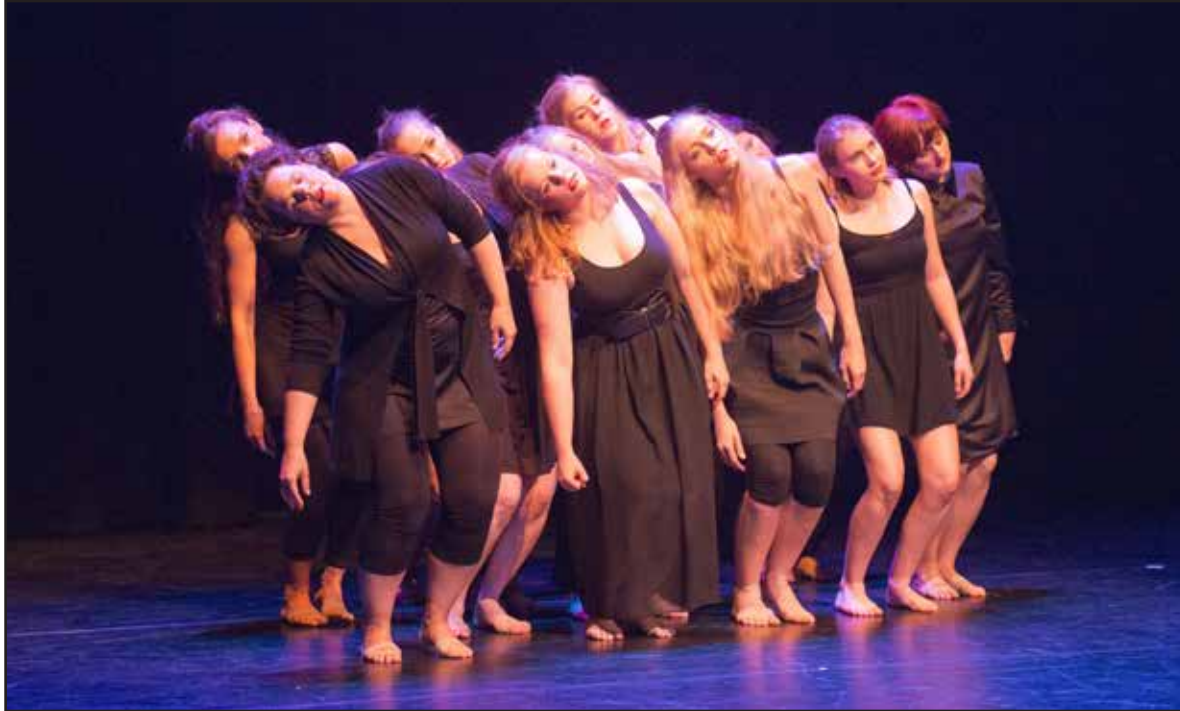
Alle dansleerlingen van balletstudio Ank de Voogd hebben zaterdag de voorstelling "since 1996" gedanst in het Speelhuis.

Balletstudio Ank de Voogd is te vinden in de Merelstraat in Helmond. Makkelijk te bereiken en voldoende gratis parkeermogelijkheden. Informatie vind je op de website www.balletstudioankdevoogd.nl . Bellen kan ook: 06-24564606 of mailen naar info@balletstudioankdevoogd.nl ■